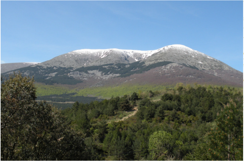
Parque Natural del Moncayo.